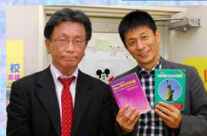
雑誌による取材にて 男優の山田雅人さんと