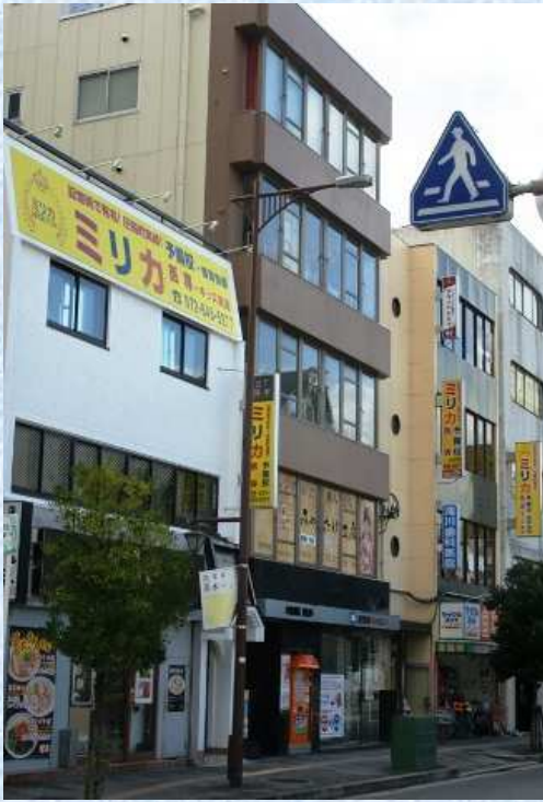
ミリカの校舎が立ち並ぶ大阪府茨木市の主要道路

成績を上げたい中学生・高校生・浪人生も同時募集中です。一度お越しいただき、塾長の無料面談から始めてください。